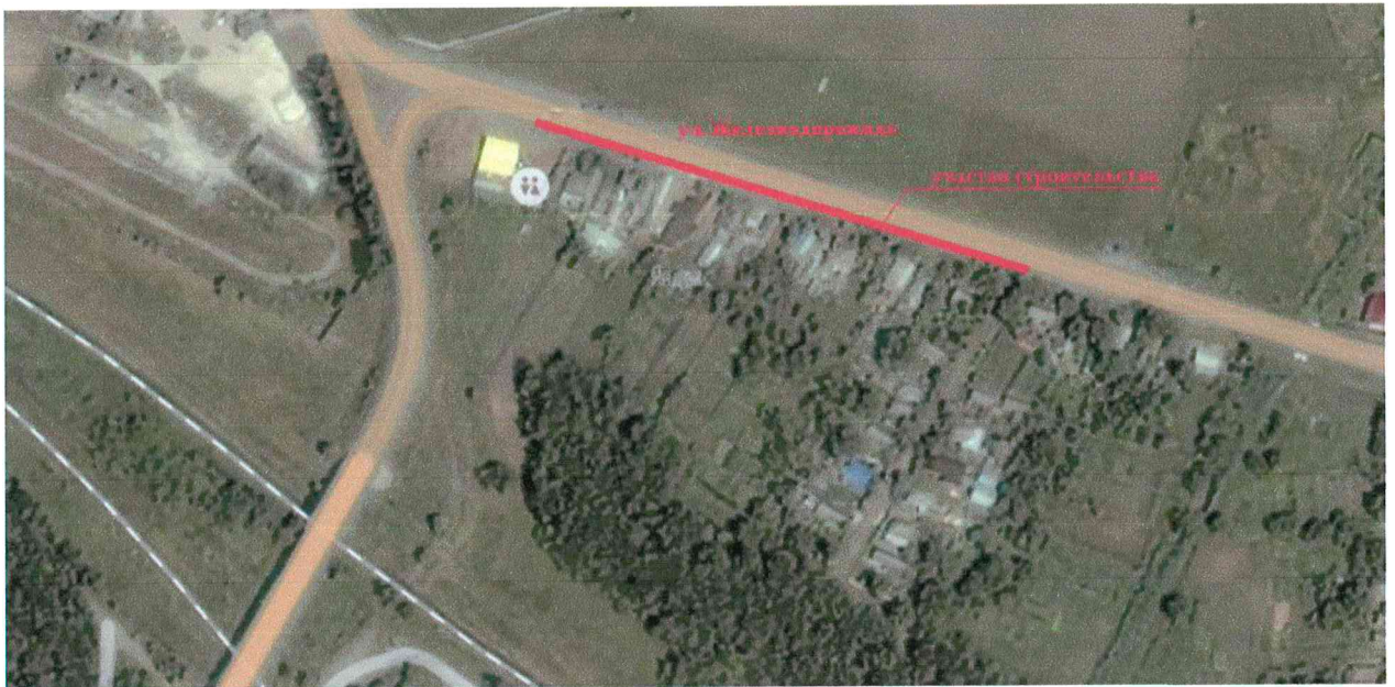
Рисунок 1. Участок проведения строительных работ

В административном отношении строящийся объект располагается на территории ст. Староминской Староминского района Краснодарского края.